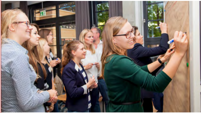
Teilnehmerinnen des Careerbuilding-Programms der Femtec